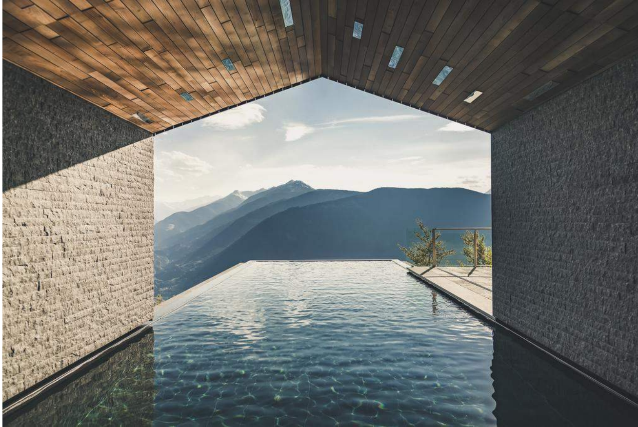
Hotel Miramonti, Hafling